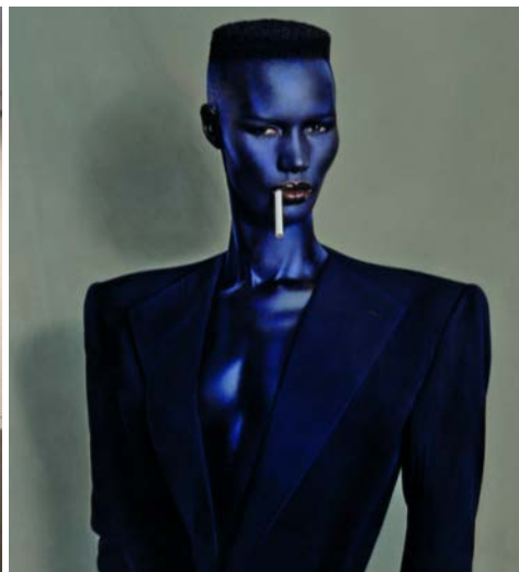
Vues de l'exposition « Années 1980, l'insoutenable légèreté » réalisée à partir des fonds du Cabinet de la photographie en 2016.