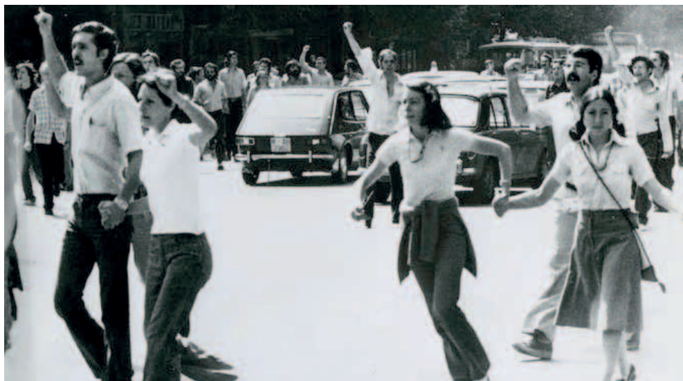
Image sur la transition espagnole

Littérature et démocratie en Inde : la littérature dalit